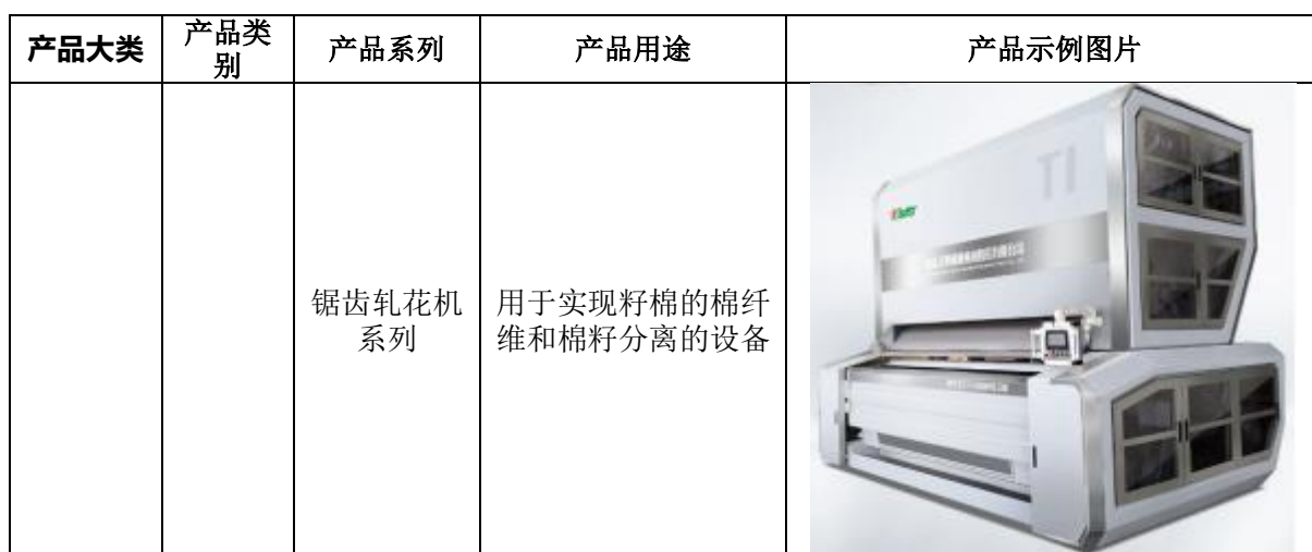
表 1: 公司棉花加工及采摘机械产品及用途

公司棉花加工机械产品按照功能不同,可分为轧花设备和剥绒设备,其中轧花设备主要包括轧花机、籽棉清理机、皮棉清理机、液压打包机等,剥绒设备主要包括剥绒机。棉花采摘机械产品根据产品功能的不同,主要包括六行自走式打包采棉机、三行自走式打包采棉机、三行自走式箱式采棉机。公司主要产品及用途情况详见表 1。